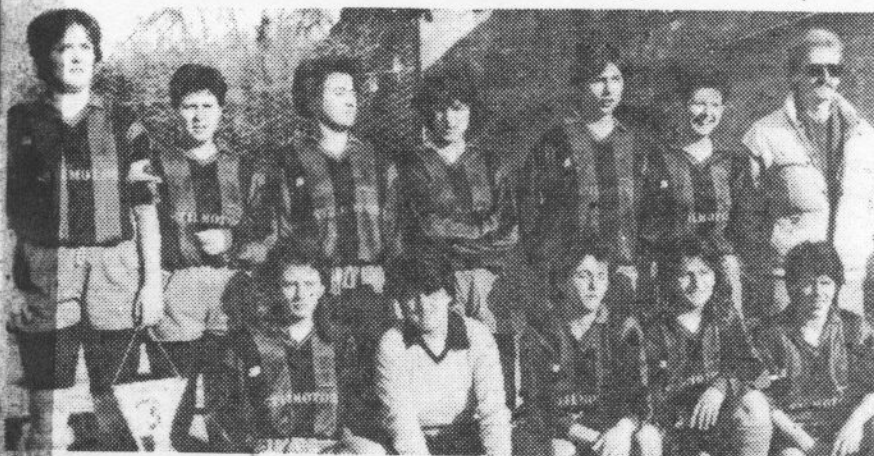
La squadra femminile della Stilmotor