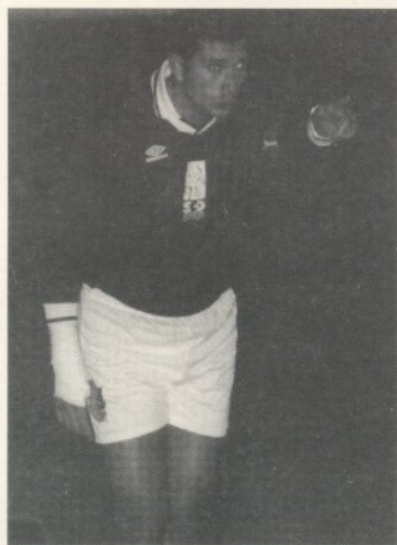
Trentini sembra indicare la strada all'Scd, terzo nel girone B della C1

La più plausibile ci sembra quella ventilata da Bertini: le "giacchette nere" con più esperienza, quelle di livello nazionale, dovrebbero fare il giro delle sezioni per chiarire gli aspetti più controversi del regolamento ai colleghi meno esperti.