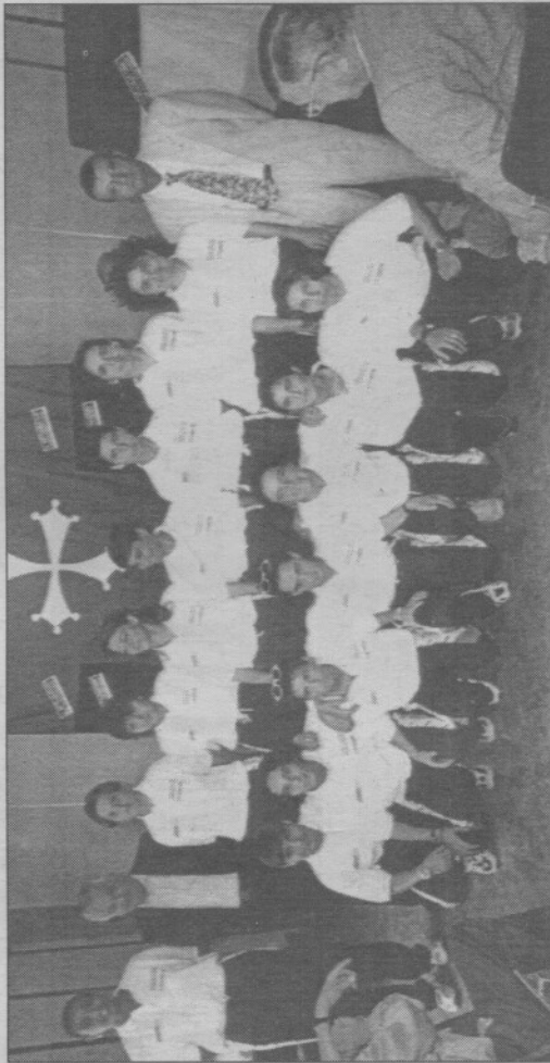
La rosa del Pisa «Il Fotoamatore» con i dirigenti alla presentazione ufficiale

ANCUNETANI. A parte l'infelice parentesi, la presentazione ha vissuto momenti di gran-