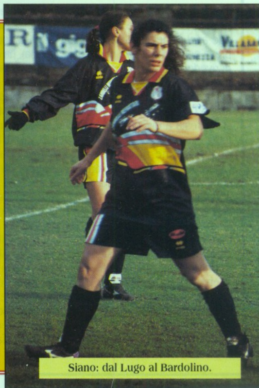
Siano: dal Lugo al Bardolino.