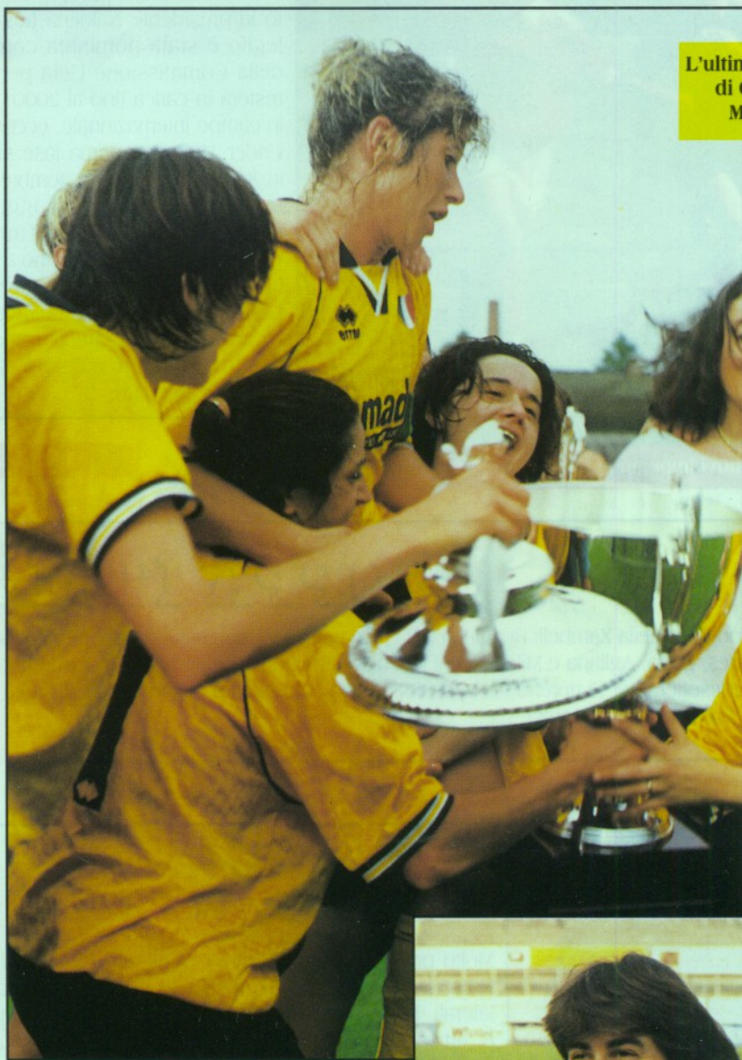
L'ultimo tricolore di Carolina Morace.