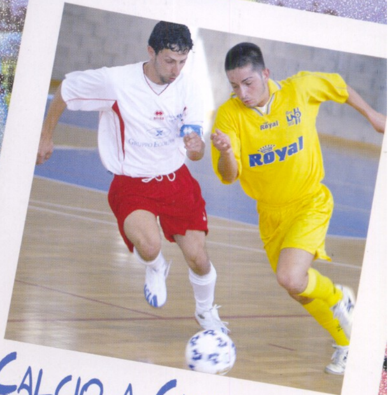
CALCIO A CINQUE

A Salsomaggiore Terme le rappresentative del Futsal e del Soccer in rosa pronte a eleggere le loro regine 2008