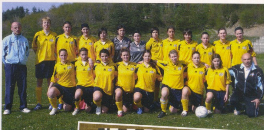
Schierati LE RAPPRESENTATIVE FRIULGIULIANE DI CALCIO A CINQUE MASCHILE E DI CALCIO A UNDICI FEMMINILE

Anche la selezione femminile ha il passaggio del primo turno come obiettivo ma, a detta dello staff tecnico, ci sarebbero le potenzialità per cercare di andare anche un po' più avanti : con un gruppo abbastanza eterogeneo per quanto riguarda l'età (si va dai 14 ai 23 anni), la selezione femminile avrà qualche problema a causa degli esami di terza media e delle superiori. Il periodo non è favorevole e quindi ci saranno alcune defezioni di elementi importanti, ma si